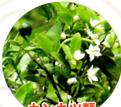
カンキツ類 の苗・枝・葉