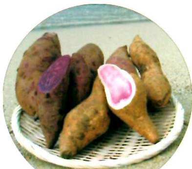
サツマイモ (紅イモを含む)