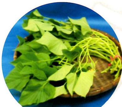
カンダバー (サツマイモの茎・葉)