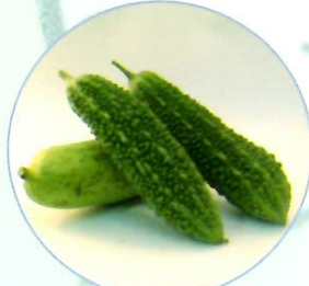
果菜類 (ゴーヤー、ヘチマ等)