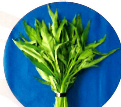
ウンチェーバー (ヨウサイ)