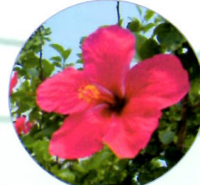
ハイビスカスの苗木

上記の植物は一例です。サツマイモは蒸熱処理をすれば、カンキツ・ゲッキツ等は検査に合格すれば持ち出せますが、必ず事前にお問い合わせください。