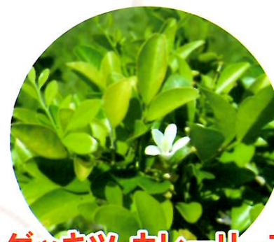
ゲッキツ カレーリーフ の苗・枝・葉