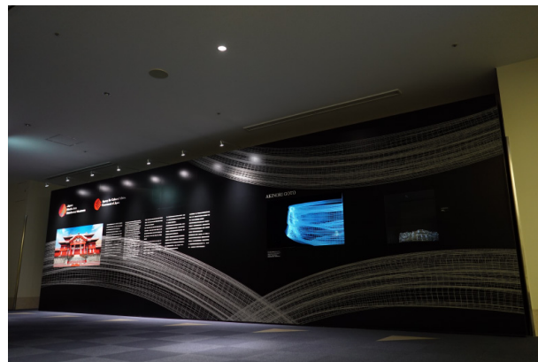
《toki- BALLET #01》展示ブース（国際線到着コンコース） ※令和2年2月16日（日）～