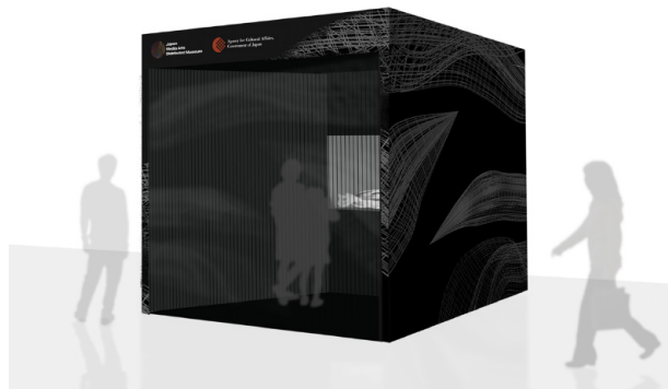
《Float #01》展示ブース（国内線出発保安検査所 C 前） ※令和2年2月29日（土）～